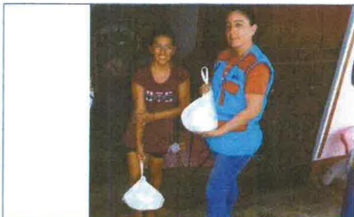
Toma fotográfica: Entrega de insumo químico (Hipoclorito de Calcio al 65%) a la Junta Administradora de Servicios de Saneamiento del Centro Poblado de Loma Saavedra, distrito de Aguas Verdes.