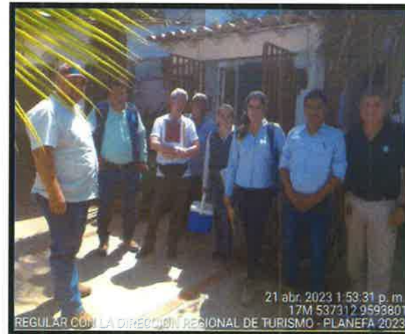
FOTOGRAFIA N°05, 06, 07 Y 08 : ACCIONES DE SUPERVISION CON LA DIRECCION REGIONAL DE COMERCIO EXTERIOR Y TURISMO, EN COORDINACION CON LA DIRECCION REGIONAL DE SALUD