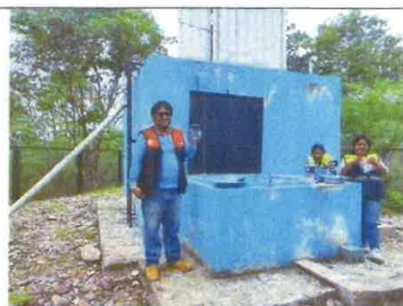
Toma fotográfica: Verificación del reservorio del Sistema de Agua Potable de la Junta Administradora de Servicios de Saneamiento Leandro Campos.