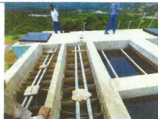
Toma fotográfica: Visita técnica a la Planta de Tratamiento de Agua Potable del Centro Poblado de Higueron, distrito de San Jacinto, Provincia de Tumbes, Departamento de Tumbes