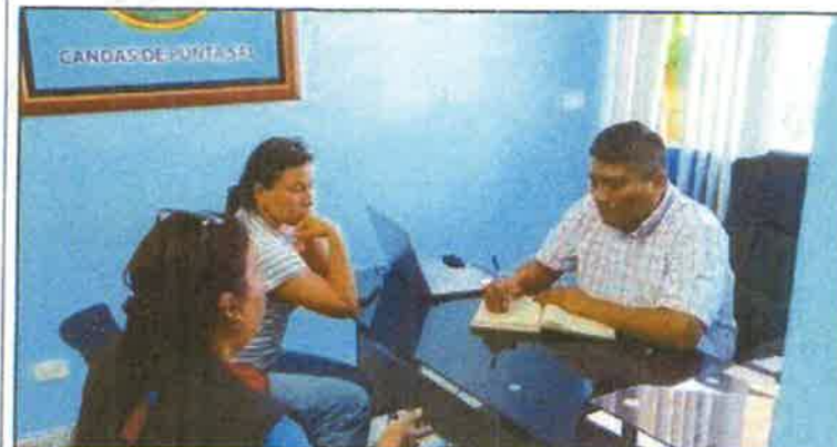
Toma fotográfica: Sesión con el Gerente General de la Municipalidad del Distrito de Canoas de Punta Sal, sobre la designación del Responsable de ATM.