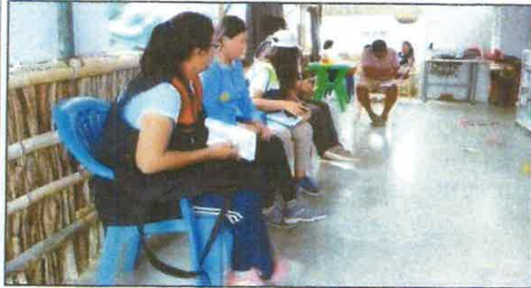
Toma fotográfica: Visita técnica al Presidente del Consejo Directivo de la Junta Administradora de Servicios de Saneamiento Fernández.