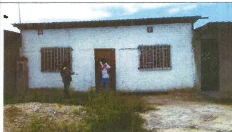
Toma fotográfica: Aplicación de fichas de Disposición Sanitaria de Excretas en el Centro Poblado de Cuchareta Alta, distrito de Aguas Verdes, Provincia de Zarumilla, Departamento de Tumbes