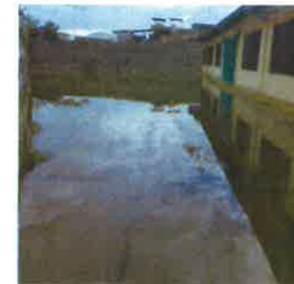
PATIO PRINCIPAL Y AULAS AFECTADAS