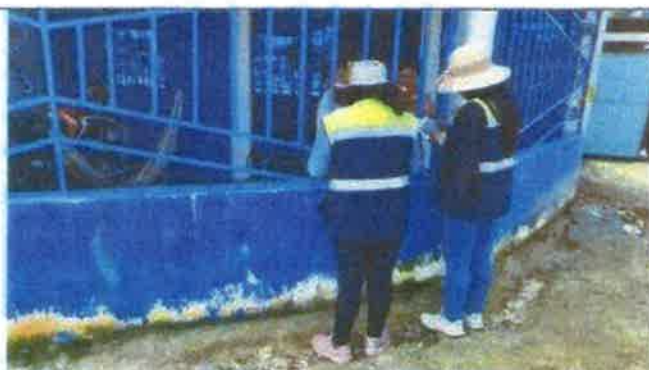
Toma fotográfica: Aplicación de fichas de Disposición Sanitaria de Excretas en el Centro Poblado de Nuevo Progreso – El Tutumo, distrito de Matapalo, Provincia de Zarumilla, Departamento de Tumbes.