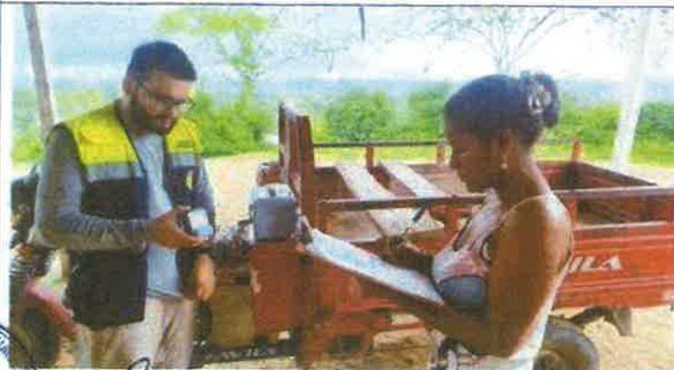
Toma fotográfica: Monitoreo de cloro residual en las viviendas de los asociados, se obtuvo resultados dentro de los LMP establecidos por Salud en el Centro Poblado de La Totora, distrito de Matapalo, Provincia de Zarumilla, Departamento de Tumbes.