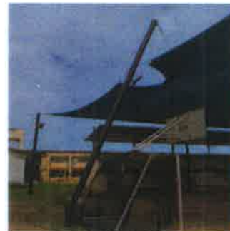
COLAPSO DE TECHO

Ubicación: C. Pob. Andrés Araujo – Distrito Tumbes