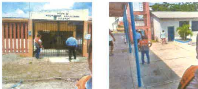
AULAS AFECTADAS Y POZO DE AGUA CON RAJADURAS

Ubicación: Localidad Papayal – Distrito Papayal