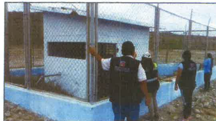
Toma fotográfica: Verificación de la captación del Sistema de Agua Potable de la Junta Administradora de Servicios de Saneamiento Fernández.