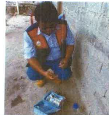
Toma fotográfica: Monitoreo de cloro residual en las viviendas de los asociados, se obtuvo resultados dentro de los LMP establecidos por Salud en el Centro Poblado de Nuevo Progreso – El Tutumo, distrito de Matapalo, Provincia de Zarumilla, Departamento de Tumbes.