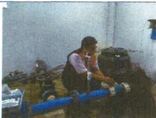
Toma fotográfica: Verificación de la bomba dosificadora de cloro en el sistema de agua potable de Nuevo Progreso – El Tutumo, distrito de Matapalo, Provincia de Zarumilla, Departamento de Tumbes.