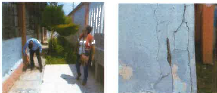
PARED Y COLUMNAS CON RAJADURAS

Ubicación: Localidad Uña de Gato – Distrito Papayal