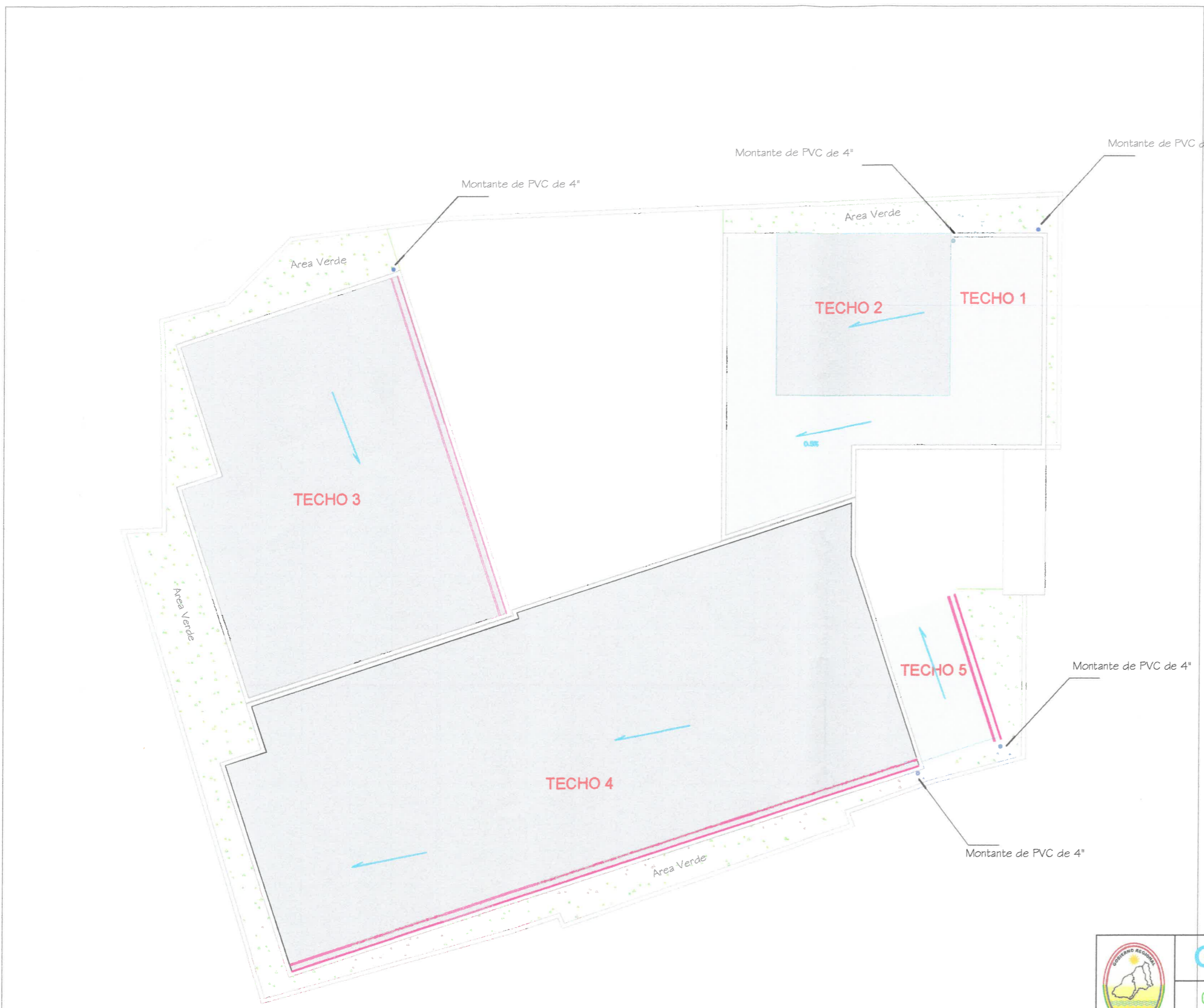
PLANTA GENERAL TECHOS ESC:1/75