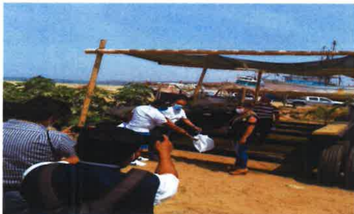
Ilustración 1 Entrega de la carreta de 30Tn, en el Distrito La Cruz