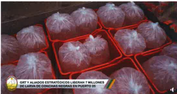
GRT Y ALIADOS ESTRATÉGICOS LIBERAN 7 MILLONES DE LARVA DE CONCHAS NEGRAS EN PUERTO 25