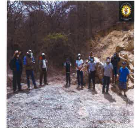
SECTOR CHARAN - LACRUZ