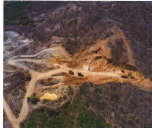
SECTOR BRUJAS SAN JUAN DE LA VIRGEN