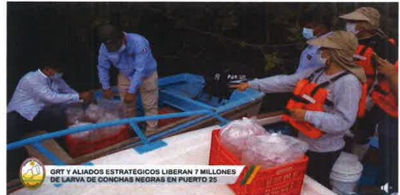
GRT Y ALIADOS ESTRATÉGICOS LIBERAN 7 MILLONES DE LARVA DE CONCHAS NEGRAS EN PUERTO 25