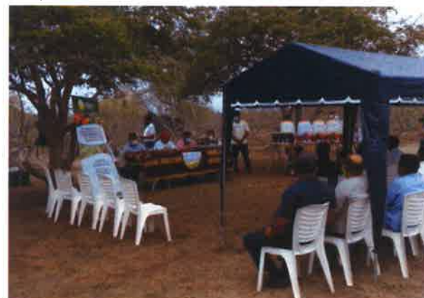
Entrega de equipos y herramientas a los productores de ciruela de la asociación regional.