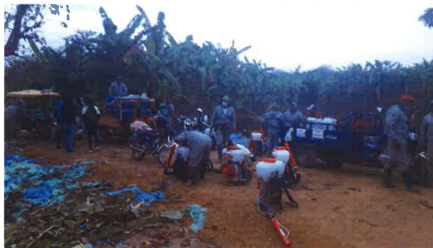
Entrega de equipos y herramientas a los productores de ciruela de la asociación regional