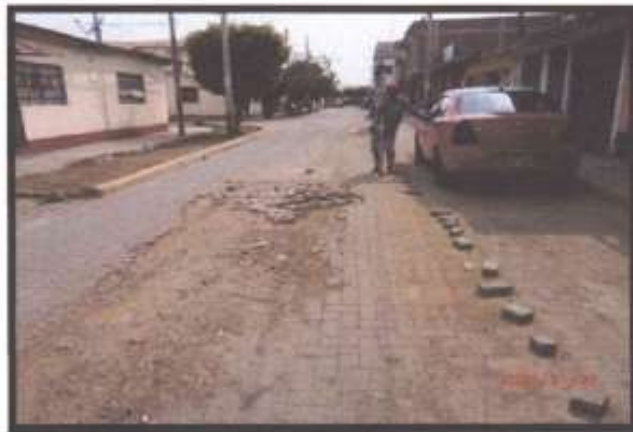
Foto N°01: se puede identificar que las fallas que se presentan, como se observan en la siguiente es deterioro total en tramos, ahuecamiento y desgaste de superficie.

Calle Jorge Herrera. - presenta deficiencias en su superficie de rodadura (Adoquines de concreto rectangulares), ya que presenta hundimientos y existen tramos donde el adoquín ha sido destruido en su totalidad producto del FEN 2017, las fallas que se pueden identificar son Abultamiento, ahuecamiento, Desgaste de superficie, falta de confinamiento interno, Por lo cual se puede deducir que el porcentaje de deterioro de acuerdo a la presencia en campo es de 80% aproximado.