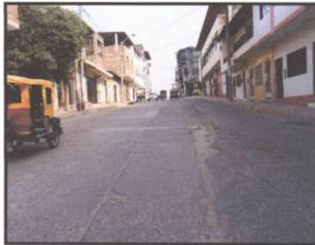
Foto N°05: se puede identificar en la siguiente imagen que existentes agrietamientos, desgaste, asentamientos excesivos, fisuras transversales entre otros.

Foto N°04: se puede identificar en la siguiente imagen que existentes fisuras de esquina en algunos paños, además de fisuración transversales media, y desgaste de superficie.