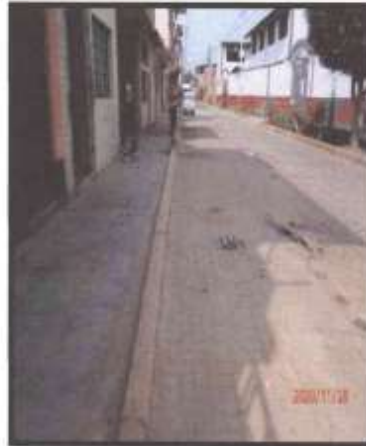
Foto N°02 y 03: se puede identificar que las fallas que se presentan, como se observan en la siguiente imagen es falta de confinamiento, abultamiento, desprendimientos, desgastes entre otros.

"Año del Bicentenario del Perú 200 Años de Independencia"