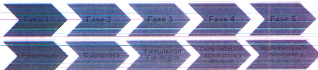
Gráfico N° 2: Fases para la elaboración de un plan de cultura

Las primeras cuatro fases corresponden a la elaboración y aprobación del Plan, mientras que la última integra la implementación, monitoreo y evaluación, con el propósito de promover la mejora continua.