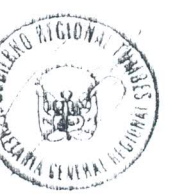
Tabla Reg. Tumbes Com. Dist. Regional Trámite Documentario Folios 330 Trescientos treinta

Gobierno Regional Tumbes Secretaría General Regional Folios 331